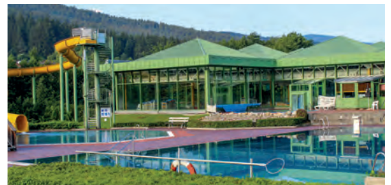
Wander und Aktivhotel Rösslwirt**** DE Kalkar-Kehrum, Nordrhein-Westfalen