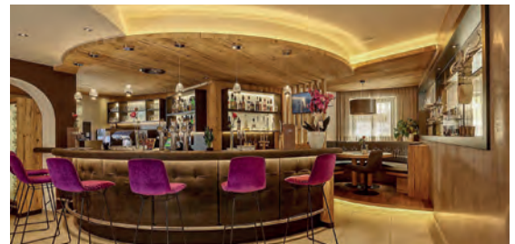
Wohlfühl-Hotel Gundolf**** AT St. Leonhard im Pitztal, Tirol