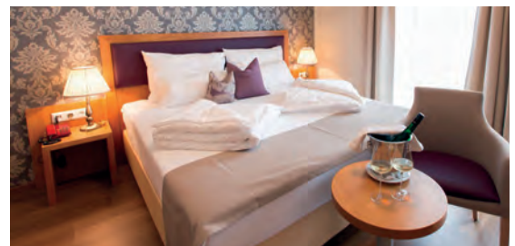
Residenz Wachau**** AT Aggsbach-Dorf, Niederösterreich