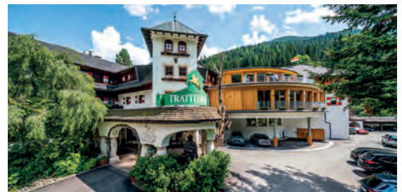
Hotel GUT Trattlerhof & Chalets**** AT Bad Kleinkirchheim, Kärnten