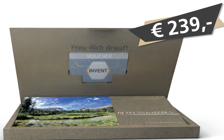
Box, Standard-Banderole und Hotel-Katalog inklusive