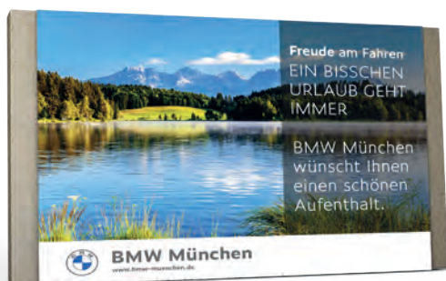
Top-Kunde - BMW AG München