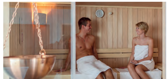
Landhaus Beckmann**** DE Kalkar-Kehrum, Nordrhein-Westfalen