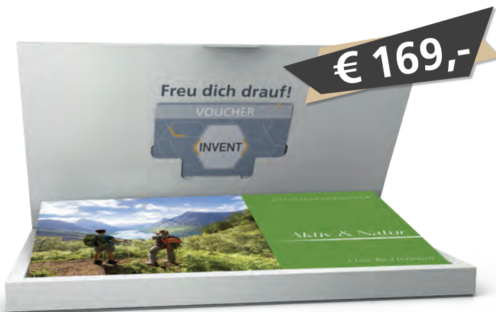
Box und 6-seitiges Booklet inklusive