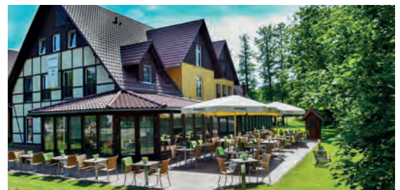
Spree Balance Kur & Wellness Haus****S DE Burg, Brandenburg