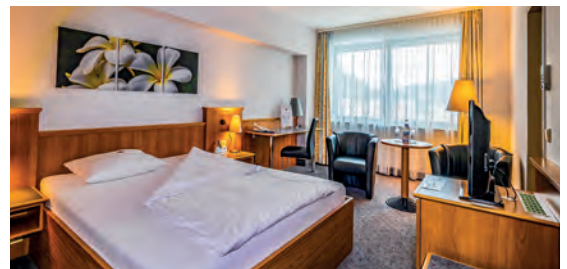
City Hotel am CCS**** DE Suhl, Thüringen