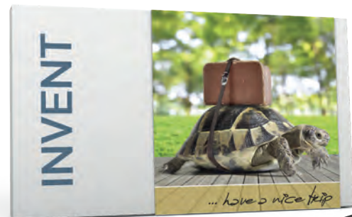
...HAVE A NICE TRIP