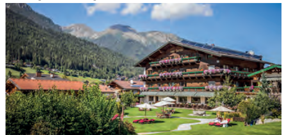
Familien- & Vitalhotel Auenhof**** AT Fulpmes-Medraz, Tirol