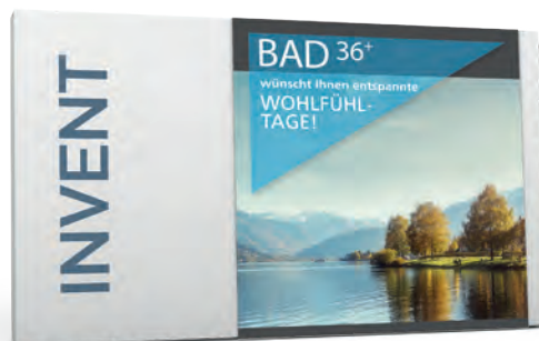
Top-Kunde - BAD 36+ GmbH