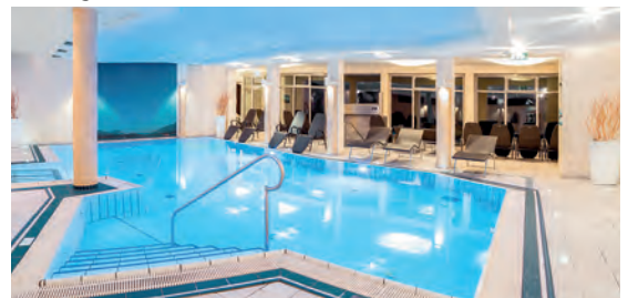
Alpen Adria Hotel & Spa**** AT Hermagor, Kärnten