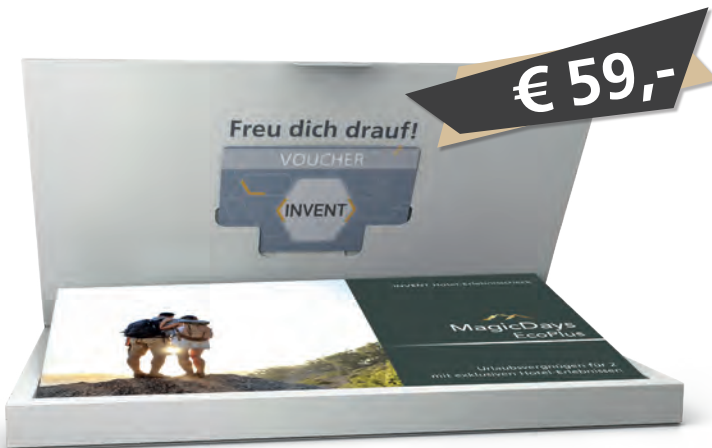
Box und 6-seitiges Booklet inklusive

Diese Edition beinhaltet eine exklusive Auswahl von Hotels, die ihren Fokus auf das Thema „Nachhaltigkeit“ legen.