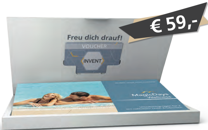
Box und 6-seitiges Booklet inklusive