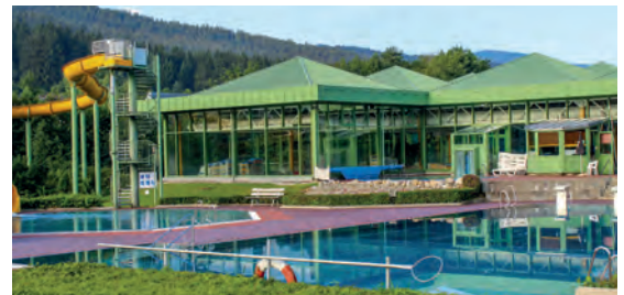
Wander und Aktivhotel Rösslwirt****S DE Lam, Bayern