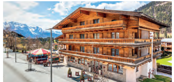
Relax- & Wanderhotel Wenger Alpenhof AT Werfenweng, Salzburg