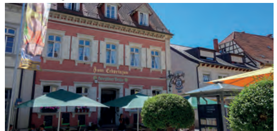
Hotel Restaurant Erbprinz Walldorf DE Walldorf, Baden-Württemberg