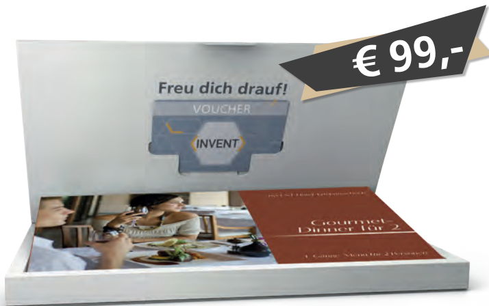
Box und 6-seitiges Booklet inklusive

Top-Partner der Edition „Gourmet-Dinner für 2“