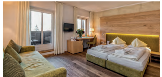
Hotel Post Tolderhof**** IT Oberolang, Südtirol