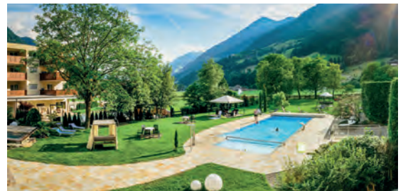
Hotel Wiesenhof***** IT St. Leonhard in Passeier, Südtirol