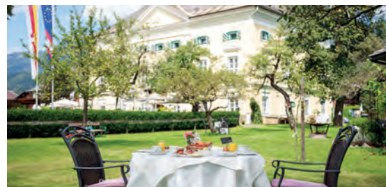
Hotel SCHLOSS LÄRCHENHOF**** AT Hermagor, Kärnten