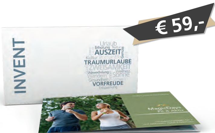
Box und 6-seitiges Booklet inklusive