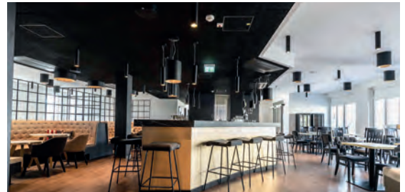
Abasto Hotel München***S DE München, Bayern