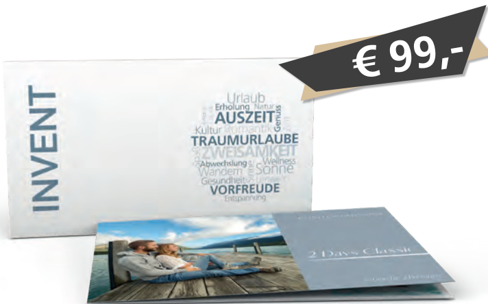
Box und 6-seitiges Booklet inklusive