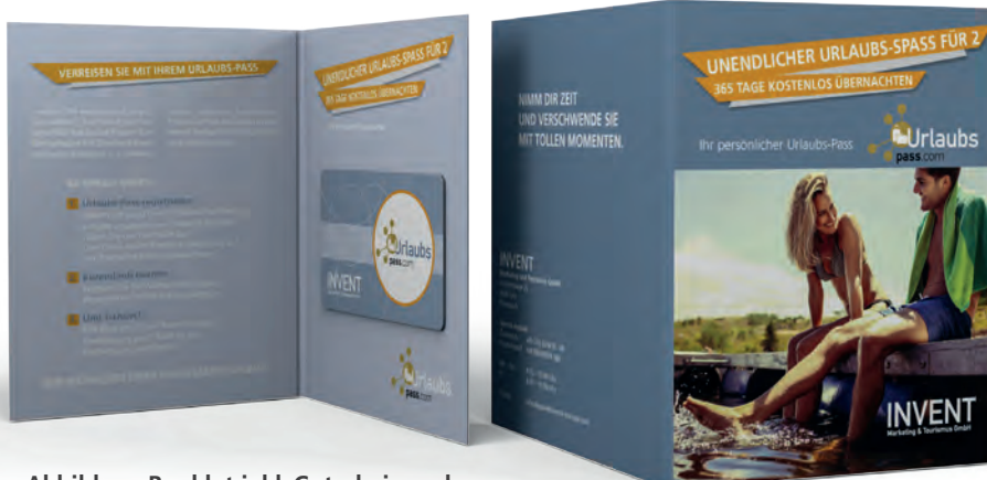
Abbildung Booklet inkl. Gutscheincard