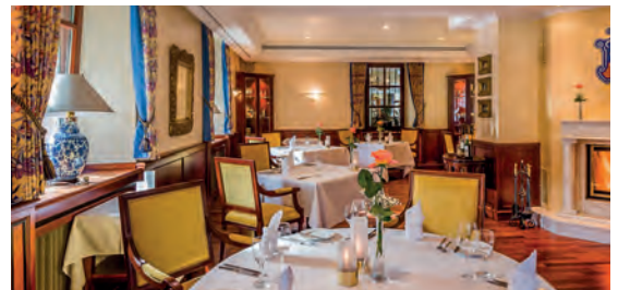
Hotel Villa Marburg im Park**** DE Heigenbrücken, Hessen

Top-Partner der Edition „Wellness & Lifestyle“