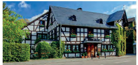
Romantik Hotel Alte Vogtei DE Hamm/Sieg, Rheinland-Pfalz

Top-Partner der Edition „Stil & Ambiente“