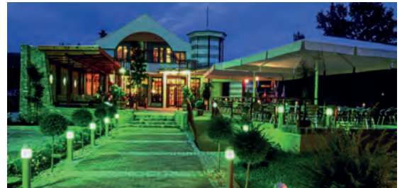
Boutique Hotel Erla**** AT Stubenberg am See, Steiermark