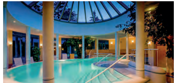
Wellnesshotel Allmer**** AT Bad Gleichenberg, Steiermark