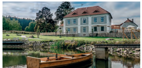
Hotel Knizeci cesta**** CZ Horni Plana, Jihočeský kraj