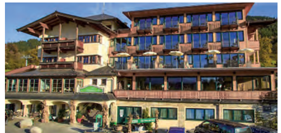
Hotel Penzinghof**** AT Oberndorf, Tirol