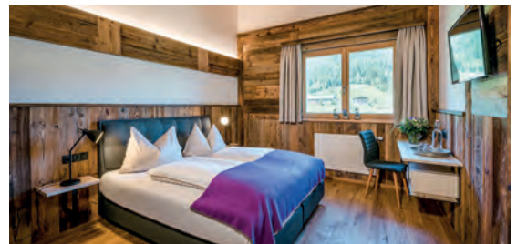
almlust AT Flachau, Salzburg