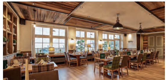
Hotel Restaurant Landhaus Großes Meer DE Südbrookmerland, Niedersachsen