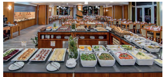
Hotel Srní**** CZ Kašperské Hory, Plzeňský kraj