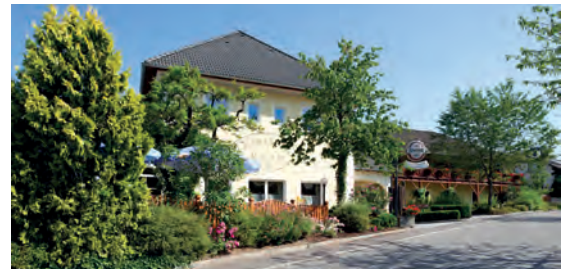
Der Dorfwirt*** AT Rechberg, Oberösterreich

Top-Partner der Edition „2 Days Classic“