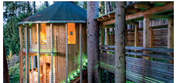
Biohotel Grafenast AT Pillberg bei Schwaz, Tirol