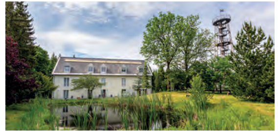
Berghotel Drei Brüder Höhe*** DE Marienberg, Sachsen