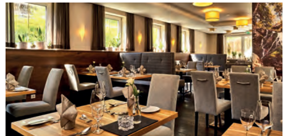
Das Reiners DE Grafenau, Bayern