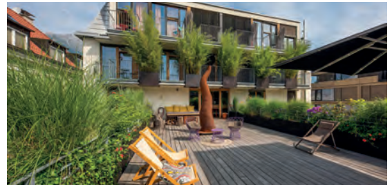
NALA individuellhotel AT Innsbruck, Tirol