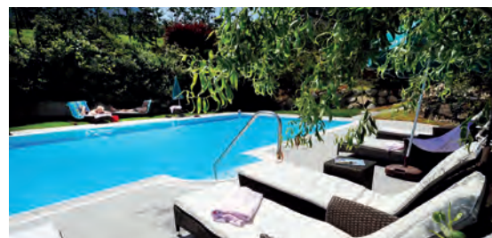
Hotel & Restaurant Kirchsteiger**** IT Völlan bei Meran, Trentino-Südtirol

Top-Partner der Edition „Gourmet & Genuss“